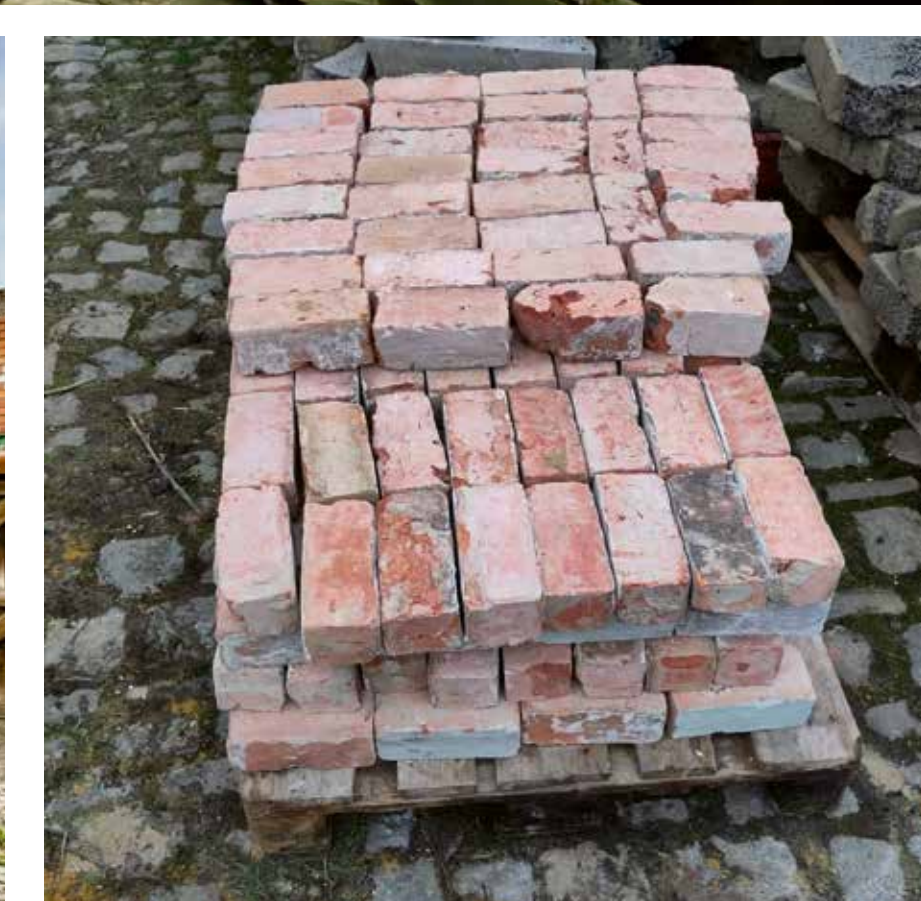
25, Rue Pierre Decoster 1190 Forest