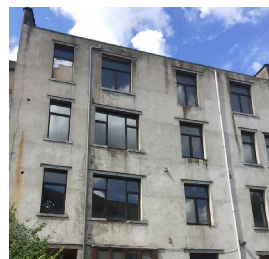
Avenue Sleenckx, 94 - 96 1030 Schaarbeek